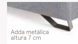
Adda metálica altura 7 cm