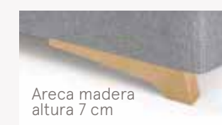
Areca madera altura 7 cm