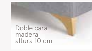
Doble cara madera altura 10 cm