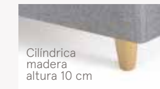
Cilíndrica madera altura 10 cm