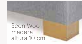
Seen Woo madera altura 10 cm