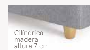
Cilíndrica madera altura 7 cm