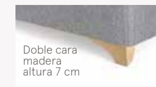
Doble cara madera altura 7 cm