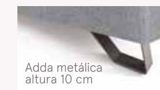
Adda metálica altura 10 cm