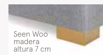
Seen Woo madera altura 7 cm