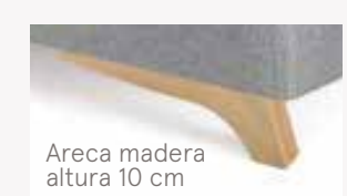
Areca madera altura 10 cm