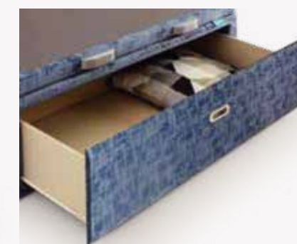
Opción frente de cajón tapizado