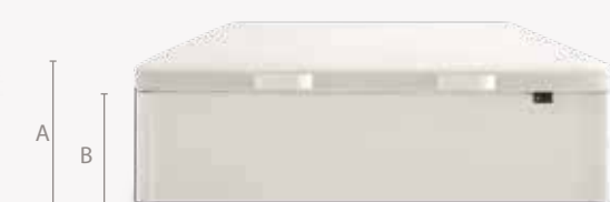
• A (Altura total) 37 cm • B (Capacidad util interior) 27 cm