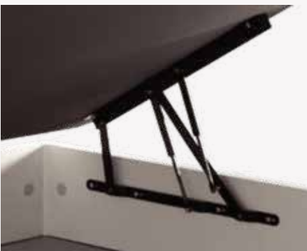
Bisagra grande doble pistón de serie