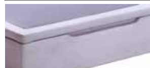
Carla 36 ptos. (Tirador con rebaje en picero)