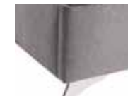
Pekín color Brillo

18 ptos. altura pata: 10 cm. altura total canapé: 40 cm. Admite robot aspirador