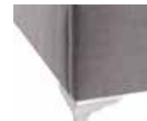
Okal color Mate

30 ptos. altura pata: 10 cm. altura total canapé: 40 cm. Admite robot aspirador