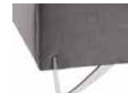
Venka color Brillo

44 ptos. altura pata: 12 cm. altura total canapé: 42 cm. Admite robot aspirador