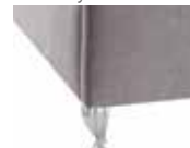
Saray color Brillo

44 ptos. altura pata: 14 cm. altura total canapé: 44 cm. Admite robot aspirador